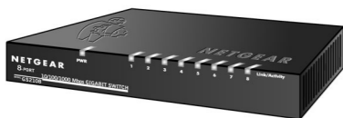
Gigabit Ethernet スイッチ GS2108

NETGEAR 8ポート Gigabit Ethernet スイッチ Model GS2108は、低価格、高信頼性、かつ高性能なスイッチです。GS2108には、8台のEthernet機器(PC、サーバ、ルータなど)をギガビット・スピードで接続することができます。