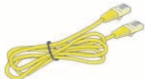
イーサネットケーブル