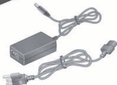
電源アダプターと電源コード (モデルにより異なります。)

重要： ReadyNAS に電源アダプターを接続する前に、該当するハードウェアマニュアルの「安全上の注意」の項目をご覧ください。