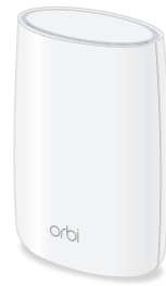
Orbi サテライト (型番: RBS50)